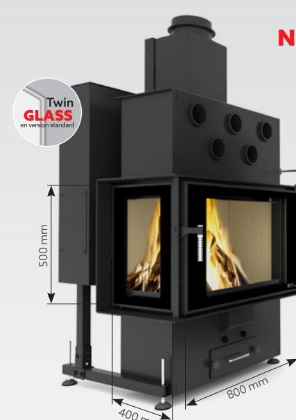
LOUIS CORNER LEFT AIR 10 kW | jusqu'à 170 m 2 réservoir de: 30 kg ou 45 kg