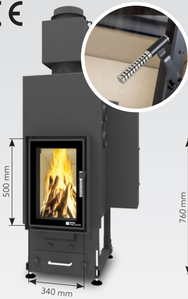
FELIX AIR 10 kW | jusqu'à 150 m 2 réservoir de: 30 kg