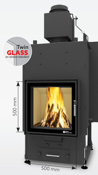
ALEX AQUA 15 kW | jusqu'à 200 m 2 réservoir de: 30 kg