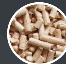
LES GRANULÉS DE BOIS