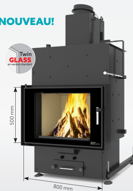
LOUIS PANORAMA AQUA 15 kW | jusqu'à 200 m 2 réservoir de: 45 kg ou 30 kg