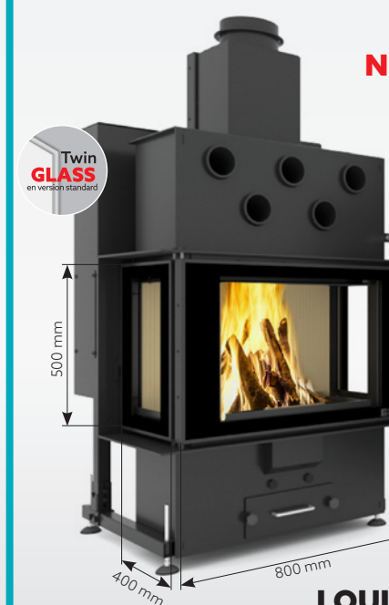
LOUIS GRAND AIR 10 kW | jusqu'à 170 m 2 réservoir de: 30 kg ou 45 kg