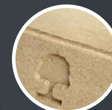
BRIQUETTES DE BOIS