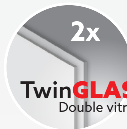
2x TwinGLASS Double vitrage