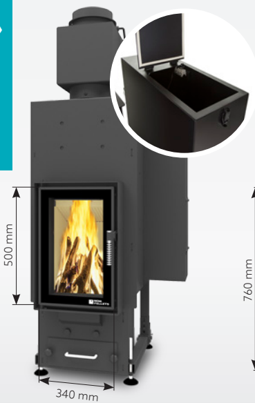
FELIX AQUA 13 kW | jusqu'à 170 m 2 réservoir de: 30 kg