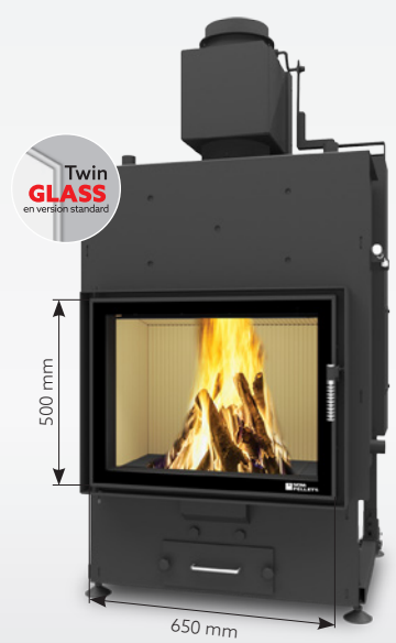
LOUIS AQUA 15 kW | jusqu'à 200 m 2 réservoir de: 45 kg ou 30 kg