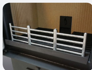
Grille de protection