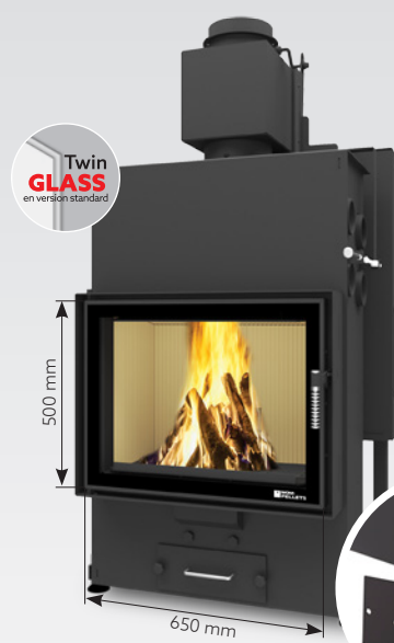
LOUIS AIR 10 kW | jusqu'à 170 m 2 réservoir de: 45 kg ou 30 kg