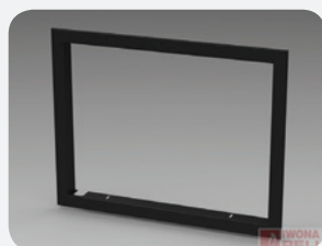
Masquage / Grille ( finition autour des portes de la cheminée)