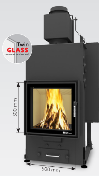
ALEX AIR 10 kW | jusqu'à 170 m 2 réservoir de: 30 kg