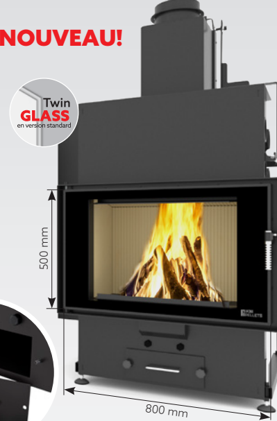
LOUIS PANORAMA AIR 10 kW | jusqu'à 170 m 2 réservoir de: 45 kg ou 30 kg