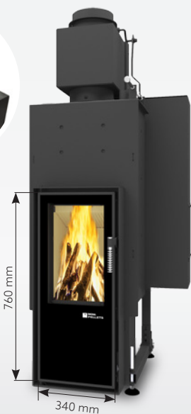
FELIX LONG AQUA 13 kW | jusqu'à 170 m 2 réservoir de: 30 kg