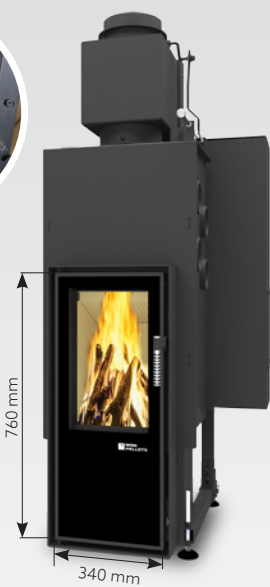
FELIX LONG AIR 10 kW | jusqu'à 150 m 2 réservoir de: 30 kg