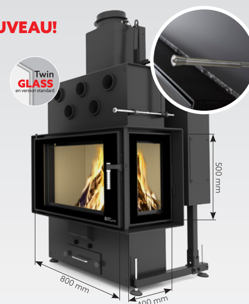
LOUIS CORNER RIGHT AIR 10 kW | jusqu'à 170 m 2 réservoir de: 30 kg ou 45 kg