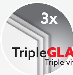
3x TripleGLASS Triple vitrage